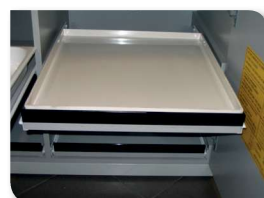
Etagère coulissante en PP (armoire sous paillasse)