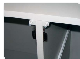
Système d'amortissage des portes