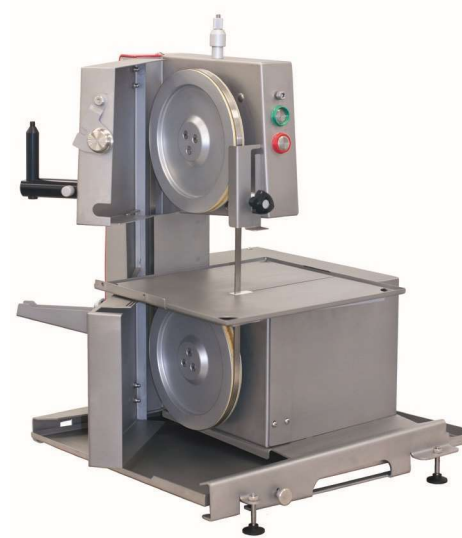
EXAKT 302 Pathology

Hauteur de connexion (mm) au-dessus de la surface de la table 245